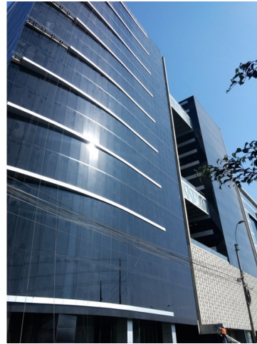
UBICACIÓN DEL INMUEBLE Santiago de Surco Lima, Lima